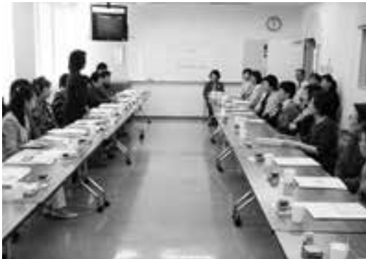
新居浜市の女性団体と意見交換