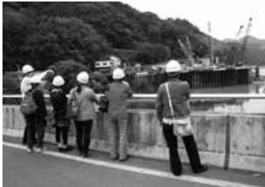
鹿野川ダムの視察研修