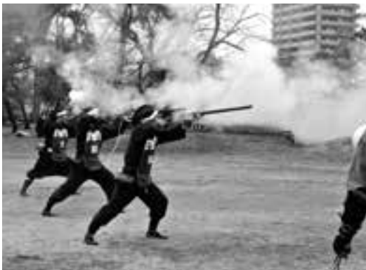
写真は、丸亀城鉄砲隊